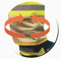
Elástico en pantalones y tobillos