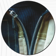
Zipper de escape